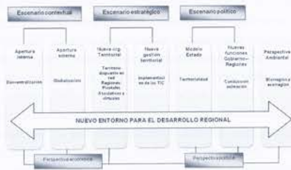
Gráfico 3. Modelo para un nuevo entorno de desarrollo territorial.

Con respecto a estas dos visiones, se puede concluir que el desarrollo es el resultado de la interacción de varios actores (agentes públicos y privados) desde un ámbito local hasta uno global. El desarrollo territorial se ha fundamentado en varios escenarios con una serie de factores internos y externos que direccionan de manera integrada un modelo de desarrollo con base en estos; el modelo de desarrollo debe plantearse por una serie de procesos que apunten a una organización y gestión territorial, enmarcados dentro de una perspectiva social, económica y política que integre y articule la consolidación de estos escenarios territoriales. En ambos casos este modelo se nutre de procesos de variada naturaleza económica, política y ambiental que soporte un nuevo entorno de desarrollo territorial que se propone en el gráfico 3.