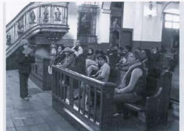
Ilustración 9. Visita a la iglesia de San Agustín, exposición y guía realizada por las niñas.