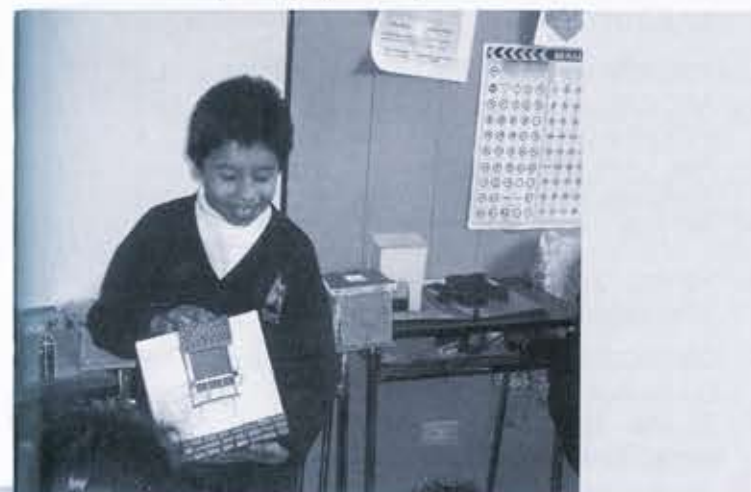
Ilustración 14. Actividad de réplica Ciudad, Patrimonio, Niños.

"Ciudad, Patrimonio, Niños" trabaja con entidades, fundaciones, colegios y comunidades que faciliten la integración entre niños de distintos estratos. Las actividades realizadas cambian en los niños la imagen negativa que tiene de la ciudad y su gente. A través de recorridos pedagógicos, talleres y charlas se enseña a los niños a valorar su ciudad y su barrio como parte de la historia de todos los ciudadanos. El compartir conocimientos con otros niños y adultos hace que el grupo multiplicador crezca día a día.