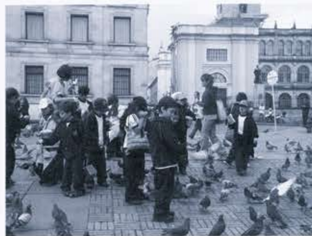
Ilustración 13. Salida pedagógica de Ciudad, Patrimonio, Niños en el Centro Histórico de Bogotá.

"Ciudad, Patrimonio, Niños" trabaja con entidades, fundaciones, colegios y comunidades que faciliten la integración entre niños de distintos estratos. Las actividades realizadas cambian en los niños la imagen negativa que tiene de la ciudad y su gente. A través de recorridos pedagógicos, talleres y charlas se enseña a los niños a valorar su ciudad y su barrio como parte de la historia de todos los ciudadanos. El compartir conocimientos con otros niños y adultos hace que el grupo multiplicador crezca día a día.