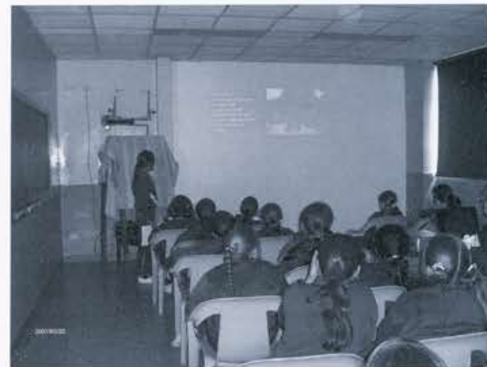
Ilustración 11. Actividad de réplica en el colegio Andrés Fey.