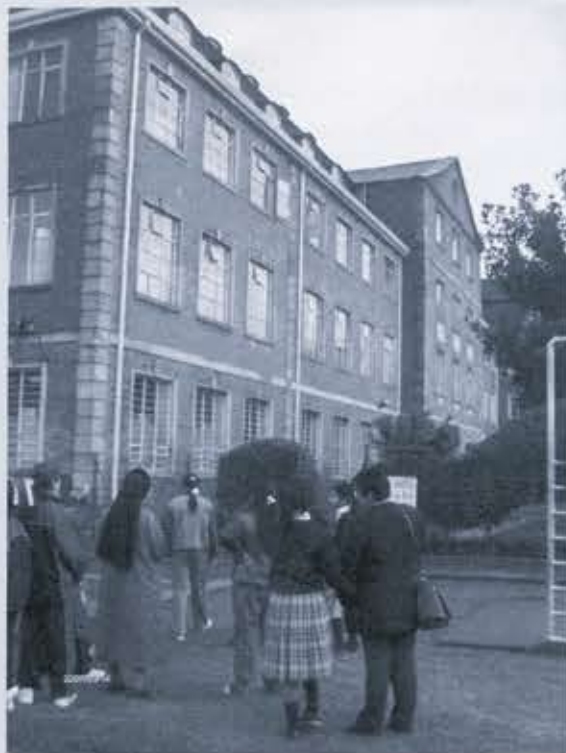
Ilustración 10. Visita al colegio Santa Clara, declarado patrimonio; guía por parte de las niñas.

- REPLICA: su objetivo fue lograr que los niños participantes compartieran los conocimientos adquiridos sobre patrimonio y ciudad con sus demás compañeros y familias. Se llevó a cabo con cada uno de los colegios. Se destacó la actitud de las demás niñas espectadoras ante la presentación, el respeto e interés con que escucharon y sobre todo, el orgullo con que las niñas del grupo presentaron el proyecto a sus compañeras. A continuación, algunos apartes de las presentaciones que hacen referencia a su opinión sobre el proyecto: