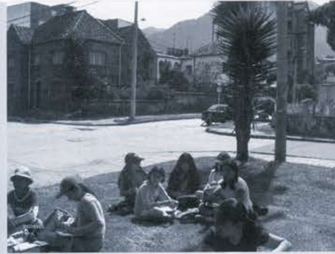
Ilustración 6. Recorrido por el barrio Palermo.

De cada actividad se extrajeron conclusiones sobre lo aprendido. Antes de visitar el centro y el centro urbano de Bosa, se realizó una encuesta sobre la imagen que las niñas tenían del lugar, la cual resultó bastante negativa. Posterior a la visita se hacían encuestas en el mismo sentido pero modificando las preguntas, y se apreciaba que con el conocimiento del lugar, la imagen del sitio y de sus habitantes había cambiado sustancialmente.