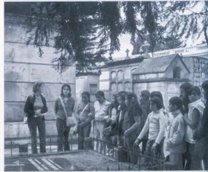
Ilustración 4. Visita al Cementerio Central.

MI CIUDAD: su objetivo era relacionar al niño con la ciudad más allá de su entorno inmediato y con los monumentos de importancia a nivel ciudad. Se escogieron como sitios a visitar el Parque Nacional y el Cementerio Central, los espacios públicos que según la encuesta preliminar eran el más y el menos conocido. La guía fue realizada por mí, con la investigación correspondiente a la historia de cada lugar.