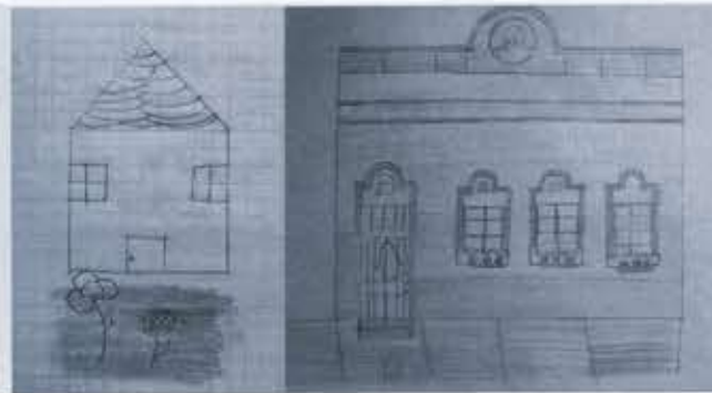
Ilustración 7. Cambio de imagen del patrimonio, barrio Santa Teresita, antes y después del recorrido.