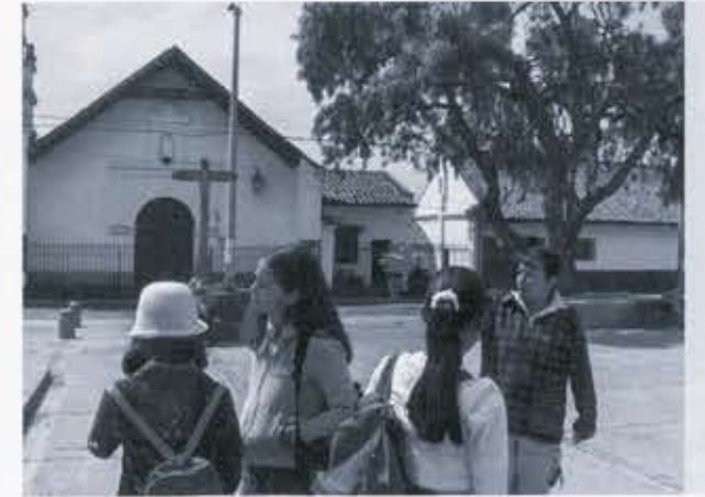
Ilustración 8. Recorrido por el Centro Urbano de Bosa. Participación de profesores.