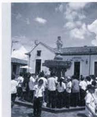
Ilustración 12. Salida pedagógica de Ciudad, Patrimonio, Niños en el Centro Histórico de Tunja.

El trabajo actual de "Ciudad, Patrimonio, Niños" se centra en dos frentes: las salidas pedagógicas y los proyectos de integración social.