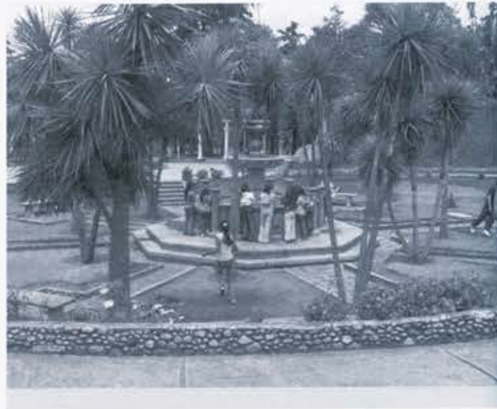
Ilustración 5. Visita al Parque Nacional.

MI BARRIO: su objetivo era que los niños conocieran el patrimonio del barrio o la localidad de los demás integrantes del grupo, esto significa, localizados en diferentes sectores de la ciudad, en diferente estado