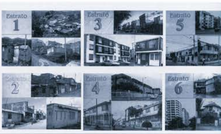
Ilustración 1. Estratos sociales en Bogotá. FUENTE: ALCALDÍA MAYOR DE BOGOTÁ. La estratificación en Bogotá D.C. y estudios relacionados. 1983-2004. Bogotá, 2005

Dada la situación social y económica de Colombia, siendo consciente de la importancia que reviste el conservar nuestro patrimonio arquitectónico, al momento de elegir el tema de mi tesis de maestría en Alemania, me planteé los siguientes cuestionamientos: