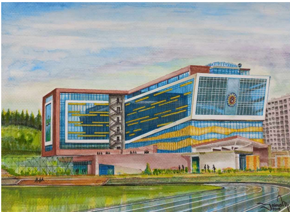
Imagen 06. Edificio Santo Domingo, Campus Av. Universitaria, p. 33 del libro No. 3, “Experiencias de Creación de Narrativas de la Acuarela y el Color”. Colección Ciudad Dibujada. Técnica: Acuarela sobre papel acuarela. Universidad Santo Tomás, Seccional Tunja – Colombia. Autor: Arq. Jairo M. Medina A.

diferentes tipos de pinceles y utensilios. La gravedad, el peso, el movimiento, las falencias, la saturación y los retos que nos lanza el tiempo, están a cargo del agua. Cargar agua, trapos, papel, paletas, cinta, esponjas, y otros, luce complejo y sedentario. Pero, ¿qué esperábamos? Es un arte.