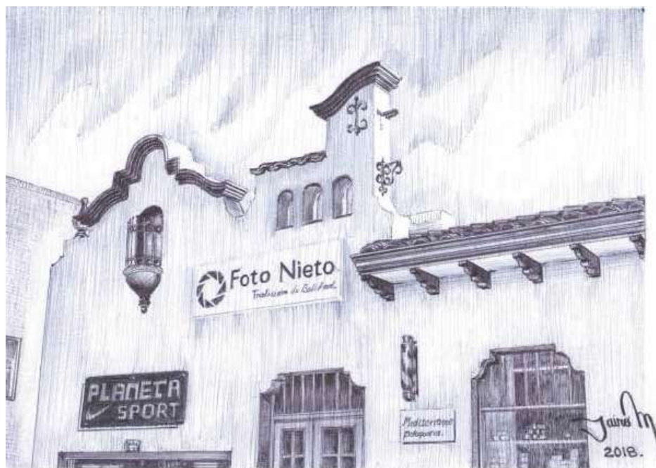
Imagen 05, Casa Período de Transición, Calle 18 entre carreras 9 y 10. Técnica: Bolígrafo sobre papel Durex, p. 39, libro No. 2, "La Historia Urbana de Tunja, a lápiz y bolígrafo." Colección Tunja, Ciudad Dibujada. Universidad Santo Tomás, seccional Tunja – Colombia.

trucción de tejidos, el blanco papel y el buen hábito limpiar el sudor negro de la punta son la clave.