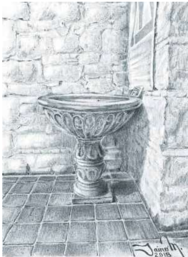
Imagen 03: Pila en San Ignacio Tunja. Técnica: Lápices sobre papel opalina, p. 91. "La Historia Urbana de Tunja a lápiz y bolígrafo". Universidad Santo Tomás, Seccional Tunja – Colombia. Autor: Arq. Jairo M. Medina A., 2018.

Lápiz color , nuestro amigo desde las épocas escolares, su más significativo atributo es la luminosidad, que se complementa con la luz y brillo del blanco papel.