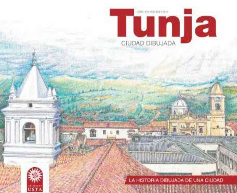
Imagen 04. Panorámica oriental desde la USTA Centro Histórico Tunja. Técnica: Lápices color sobre papel Durex. Portada libro No. 1, "La Historia Dibujada de una Ciudad" de la Colección Tunja Ciudad Dibujada. Universidad Santo Tomás, Seccional Tunja – Colombia. Autor: Arq. Jairo M. Medina A.

La superposición de capas permite explorar los colores y tonalidades de los círculos cromáticos. La mezcla se logra con una presión moderada, la intensa genera una superficie cerosa que impide la transición a un segundo color.