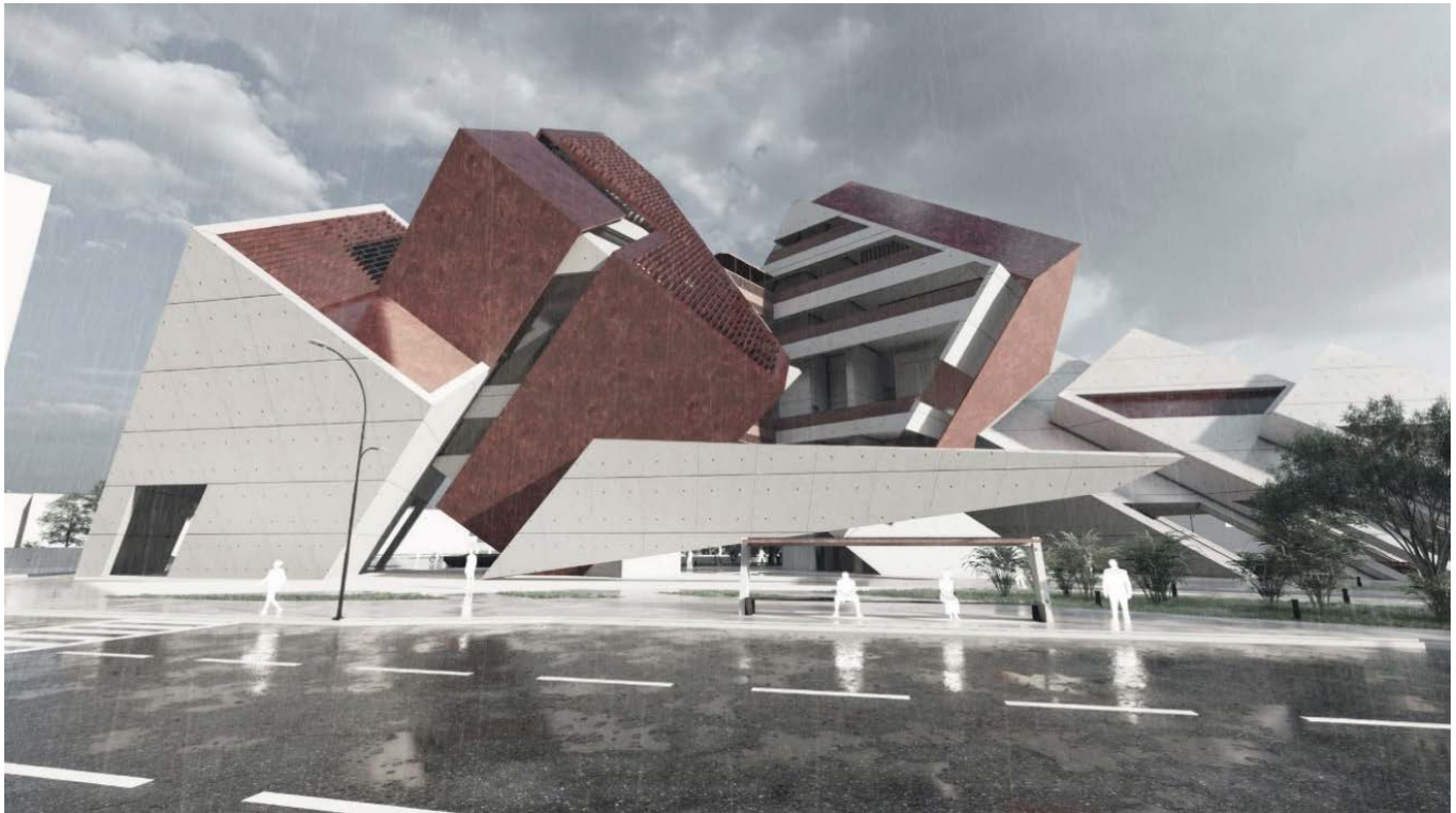
Figura 28. Perspectiva desde la avenida de las Américas