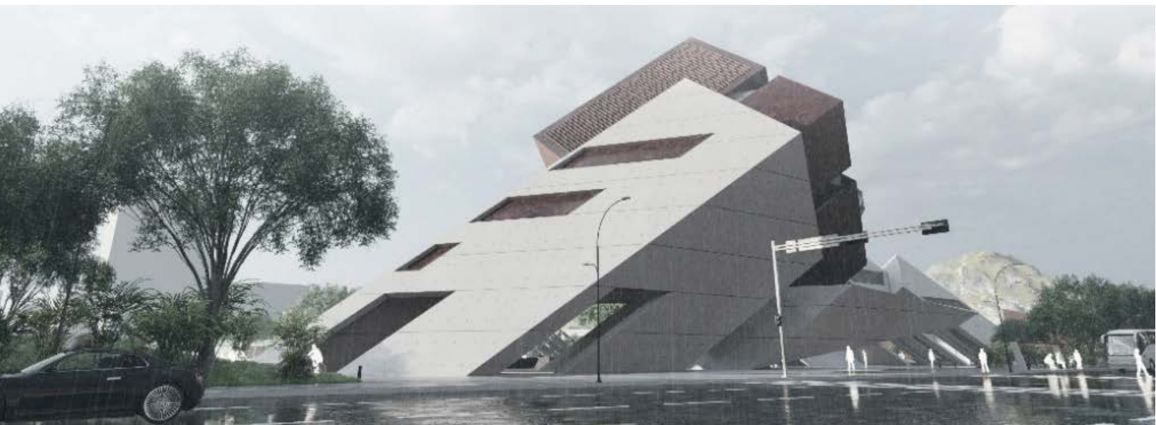
Figura 27. Proceso de diseño / Desarrollo planimétrico / Perspectiva