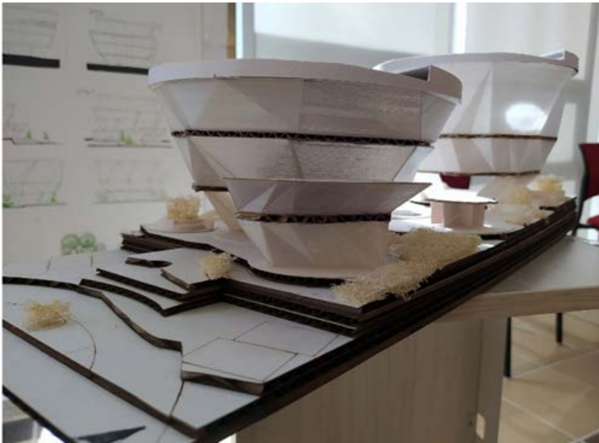
Figura 14. Maqueta ESC_1:100