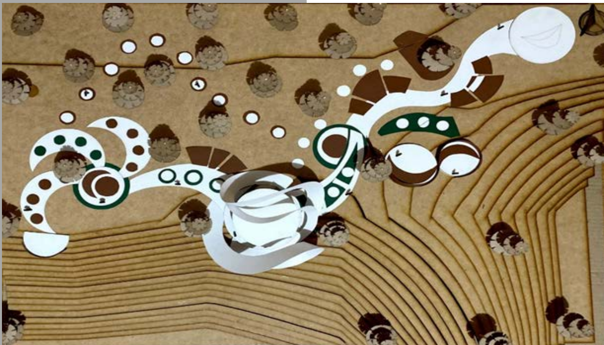
Figura 11. Maqueta. Vista superior