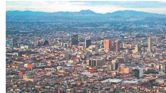
Figura 1. Panorámica de México.

La dispersión de las ciudades en el territorio trae consigo retos para su gestión y sustentabilidad,