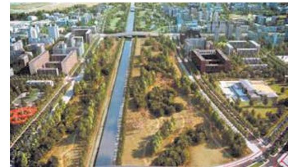
Figura 8. Urbanismo sustentable

Con todo esto, es evidente que Tunja se enfrenta a problemáticas que también otras ciudades están enfrentando. Y que es momento de empezar a repensar la forma de construir ciudad. Hoy día es notorio lo imperativo que es la conservación de los recursos naturales que aún se tienen, y es de vital importancia entender que estos recursos son pulmones verdes en las ciudades que la oxigenan y la revitalizan dando una mejor calidad de vida para sus habitantes. De esta manera se tendrán ciudades sustentables, entendiendo también la sustentabilidad como agente transformador de la ciudad, y haciendo de ella un factor indispensable a la hora de planearla y organizarla.