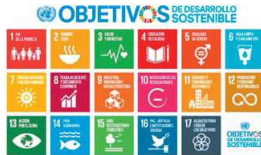
Figura 3. Objetivos de desarrollo sostenible propuesto en la nueva agenda urbana

Cabe destacar la reflexión que Sardo Daniel (2017), hacia sobre el crecimiento urbano y la relación que tiene con la sustentabilidad: “el desarrollo económico, el aumento de la población y el uso desmedido del suelo, así como la creciente preocupación ambiental, obligan al replanteamiento de los modelos de planificación, urbanización y de convivencia urbana en la búsqueda de una interacción equilibrada entre los ecosistemas naturales y los centros de población que en dichos ecosistemas naturales se desenvuelven” Resulta considerar propósitos que regulen y planifiquen