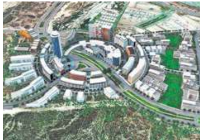
Figura 2. El desarrollo urbano sustentable

Para conceptualizar el desarrollo sustentable Banzant Jan (2014) en su libro Hacia un desarrollo urbano sustentable define el desarrollo sustentable como la integración de los aspectos económicos, sociales y ambientales a fin de producir bienes y servicios, pero a la vez reservar la diversidad y respetar la integridad funcional de los ecosistemas, minimizando su vulnerabilidad y compatibilizando los ritmos de recarga naturales como los de extracción requeridos por el propio sistema económico.