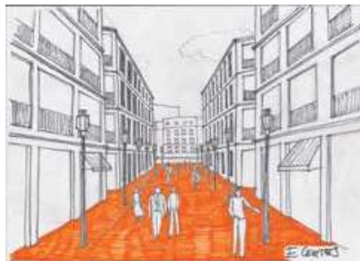
Figura 5. Nuestras ciudades.