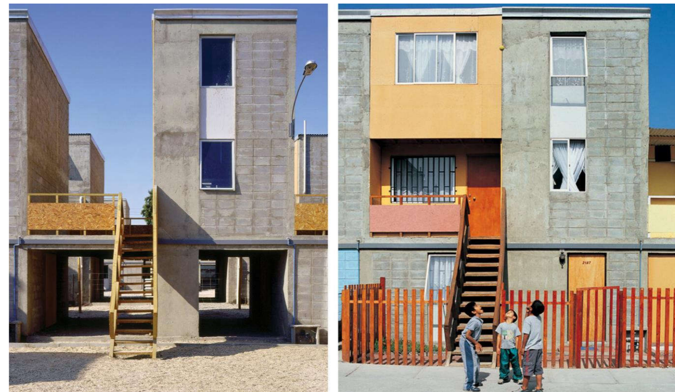
Viviendas de la Quinta Monroy en Iquique, Chile. Proyecto del estudio ELEMENTAL.

La casa galardonada con el premio de arquitectura Juana de Vega en 2014 fue precisamente la Casa Escribenta, de Emilio Rodríguez Blanco. Según palabras del propio arquitecto: “los materiales que construyen la casa son los mismos que han construido la arquitectura popular del rural, los galpones, las naves, los cerramientos de las fincas. Fungibles, de texturas profundas, cambiantes con el tiempo, con la edad esperando el musgo que los colonice, el líquen, el sol que los abraza o la lluvia que los ennegrezca.”