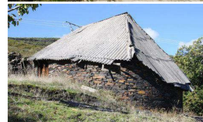
Las Pallozas son construcciones tradicionales del interior de Galicia, en la Sierra de los Ancares, construidas con gruesos muros de piedra y cubiertas cónicas vegetales.