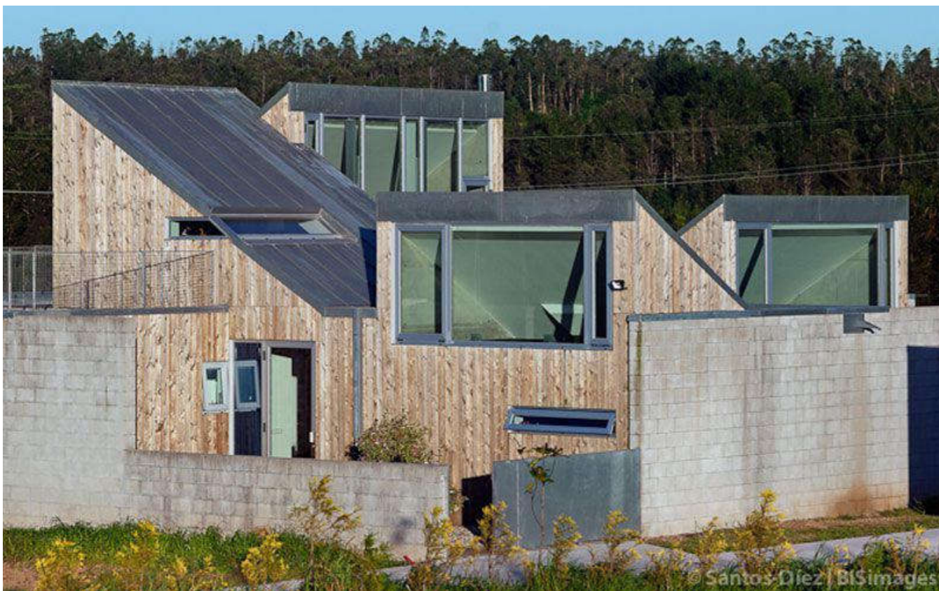
Casa Escribenta, del arquitecto Emilio Rodríguez Blanco. 21

que tal vez no se basa en unas referencias cultas o teóricas, pero que tiene por base el conocimiento de los materiales y la búsqueda de nuevas posibilidades. Incluso la aparición de tipologías como la mencionada vivienda sobre espacio productivo innova en conceptos como el del apilamiento programático tan presente en la obra de arquitectos contemporáneos como Rem Koolhaas.