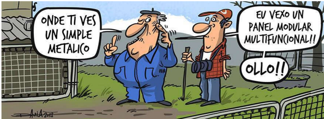
Viñeta del ilustrador gallego Luis Davila 4

Los emigrantes gallegos han supuesto una transformación de las ciudades y pueblos de una u otra manera. En el mejor de los casos con sus ahorros ayudaron a construir nuevas edificaciones, al crecimiento de la ciudad, aunque no siempre con el mejor de los resultados a causa de una legislación urbanística deficiente. En el peor de los escenarios se marcharon en busca de nuevas oportunidades, seguramente siempre con la idea de volver, dejando en Galicia sus antiguas casas abandonadas o sus proyectos a medias.