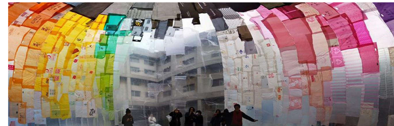
Re_create Taipei una instalación de Basurama 25 , un antedecente al Serpentine Gallery Pavilion de Selgas Cano pero con las componentes del reciclaje y la sostenibilidad.

Estudios como Basurama 23 p PKMN 24 han llevado a cabo acciones que reivindican precisamente estos procesos en los que los desechos se transforman en materia prima para llevar a cabo instalaciones que además gracias a un profundo ejercicio de proyecto y reflexión acaban teniendo resultados gratamente atractivos sin que dejemos de ser conscientes de que se han llevado a cabo con desperdicios de nuestro día a día y de la crítica que subyace en ellos al estilo de vida contemporáneo que tan lejos está de la sostenibilidad.