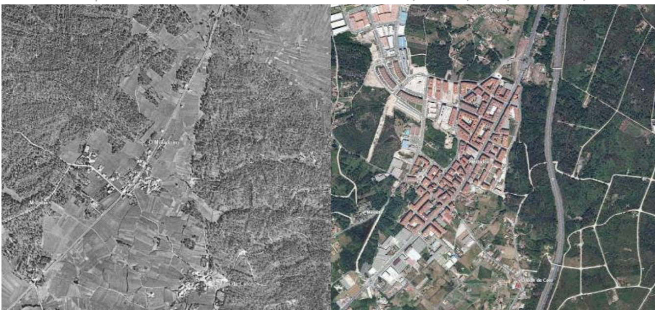
Ortofoto de O Milladoiro perteneciente al vuelo americano de 1956 frente a la imagen de satélite del 2009. 9

mejores de los que se construyen posteriormente haciendo que la ciudad pierda valor e interés para que algunos ganen dinero. Además el fenómeno de la especulación es contagioso, cuando el propietario de un hermoso inmueble (de arquitectura tradicional, o modernista, o racionalista ... que riqueza tenían los centros históricos y que poco les queda) de la coruñesa calle de San Andrés vende su parcela para que construyan en ella