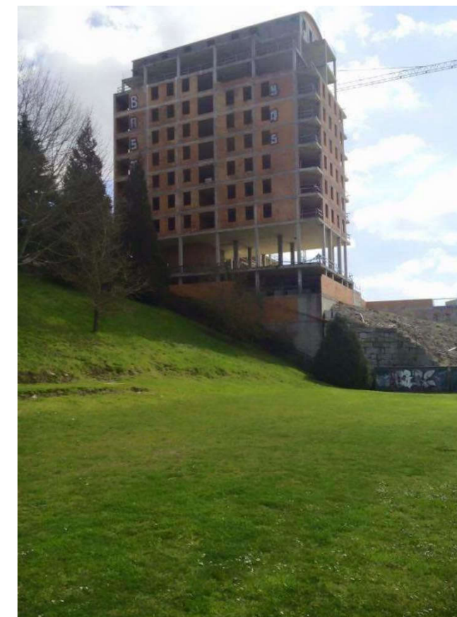
Conjunto de viviendas sin terminar en O Garañón, Lugo. 20

Lo cierto es que esta ley probablemente consiga reducir los casos de Feísmo forzando a que las obras se terminen antes “por fuera” que por dentro, pero parece que esta ley aún teniendo la voluntad de luchar por la protección del entorno natural y construido, en cuanto al Feísmo se refiere se queda en una lectura simplista del problema, únicamente atiende al carácter estético del mismo; y no aporta soluciones prácticas y realistas al problema de la especulación y los “desperdicios urbanísticos” que ha generado.