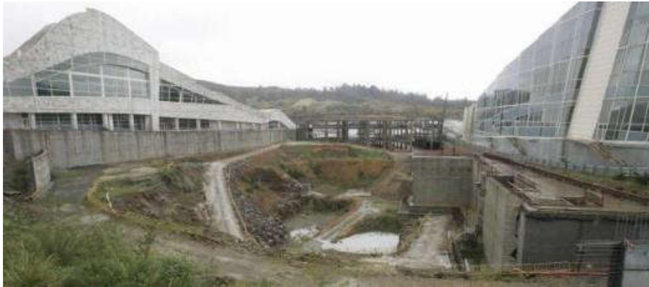
Fotografía de Xoán Álvarez 16

en cuanto percibía el lugar en la naturaleza como imagen, al empeño de fijarla, de querer retener un recuerdo seguro de tales momentos». Goethe. 15