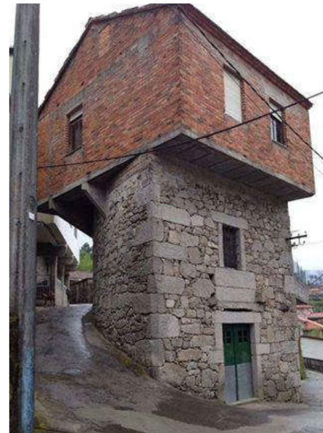
Ampliación en A Illa6 (Entrimo, Ourense) perteneciente al Parque Natural do Xurés, Reserva de la Biosfera transfronteriza (España-Portugal).

del bien conocido local comercial en planta baja, extendido en toda la construcción habitual de la ciudad; no, estamos hablando de construir sobre lo construido, algo nuevo sobre lo anterior con una naturalidad, falta de complejos y descreimiento que no tiene nada que envidiar a la Filarmónica de Hamburgo de Herzog & DeMeuron.