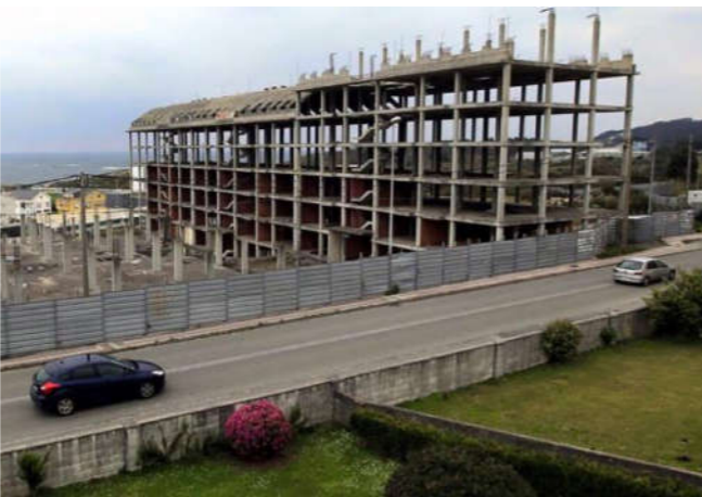
14 edificios inacabados con 532 viviendas en Cervo (4336 hab.), en la costa de la provincia de Lugo. 2

rales distraídas en la legislación urbanística para fines especulativos.