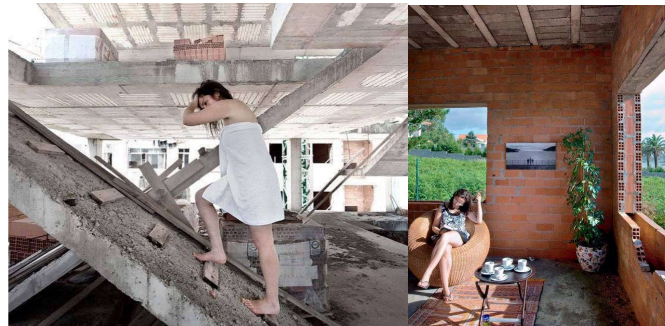
Muestra de algunas de las imágenes pertenecientes a la exposición "Spanish Dream".

parezca o debe respetar unos códigos establecidos ?. Pues evidentemente uno debe respetar unos códigos para que el patrimonio colectivo que es el paisaje, tanto natural como construido, sea respetado y conservado, y no