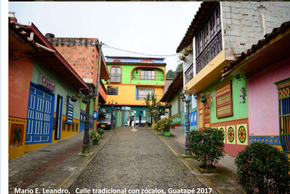
Mario E. Leandro, Calle tradicional con zócalos, Guatapé 2017

TEMAS DE ARQUITECTURA # 7 TUNJA - COLOMBIA