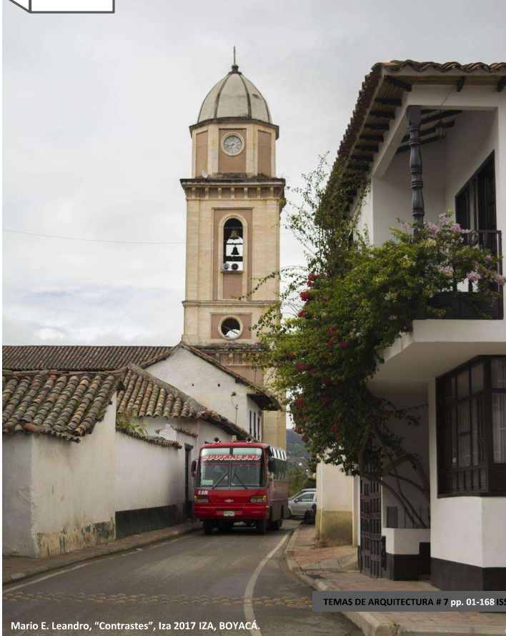
Mario E. Leandro, "Contrastes", Iza 2017 IZA, BOYACÁ.

TEMAS DE ARQUITECTURA # 7 pp. 01-168 ISSN: 2216-0191 TUNJA - COLOMBIA