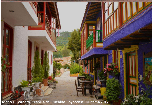
Mario E. Leandro, "Capilla del Pueblito Boyacense, Duitama 2017"