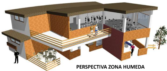
PERSPECTIVA ZONA HUMEDA

La idea es que todas estas zonas sociales cuenten con espacios verdes y zonas abiertas debido al clima. Además alrededor del lote se propuso una ciclovia que pasa por la zona social de la piscina y por la cancha de tenis y cancha múltiple.