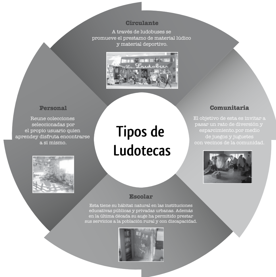
Figura 2. Tipos de ludotecas