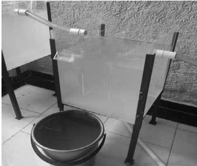
Figura 1. TANQUE No. 1.

El primer tanque que incluye el sistema, tiene la función de evitar el paso de material grueso a los demás tanques con el fin de tener una mejor calidad, mediante la implementación de dos mallas con una apertura de 2 mm, colocadas perpendicularmente al flujo del agua de manera que en ellas queden retenidos los sólidos en suspensión que queremos eliminar; es decir, que este tanque funciona como cribado del agua gris y este proceso es bastante importante en cuanto a tratamiento de agua se refiriere según Oropeza [7], además afirma Ramalho [8], el cribado ayuda a mantener en buen estado las bombas que estén presentes en el proceso, para nuestro caso, evita el taponamiento de los filtros que se puede dar con el tiempo.