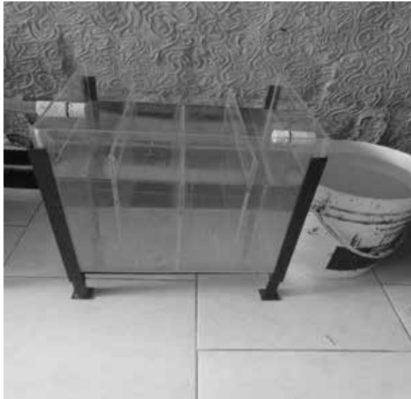
Figura 4. TANQUE No. 4.

Luego de realizarse el proceso de filtración en el tanque anterior y con el fin de hacer que las posibles partículas de grava, arena y carbón que están en el tanque 3 (filtro de gravas) y pasen al tanque 4 (sedimentador) queden retenidas en éste, se implementó un proceso de desarenado. Para esto, se instalaron 3 pantallas perpendiculares al flujo del agua de manera que el recorrido del agua sea en zigzag vertical similar al recorrido en el tanque 2; a diferencia de éste, el agua en el tanque tendrá que bajar y subir dos veces dando mayor dificultad de realizar el recorrido a las partículas de grava, arena y/o carbón y logrando así su sedimentación.