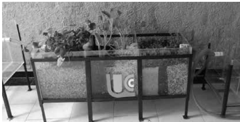
Figura 3. TANQUE No. 3.

Como su nombre lo indica, este tanque funciona como un filtro, conduciendo el agua por una serie de materiales pétreos y carbón para lograr una mejor limpieza del agua, además en la parte superior de éste se implementaron plantas con funciones de depuración llamadas macrofitas acuáticas, para generar la Fitodepuración del agua y oxigenarla, mejorando así su calidad. Se utilizaron dos tipos de carbón, carbón activado que al poseer una alta porosidad y una gran superficie específica según dice Arana [13], hace a este medio apto para el proceso de adsorción dando como resultado un óptimo tratamiento del agua.