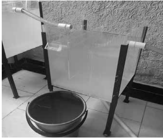
Figura 2. TANQUE No. 2.