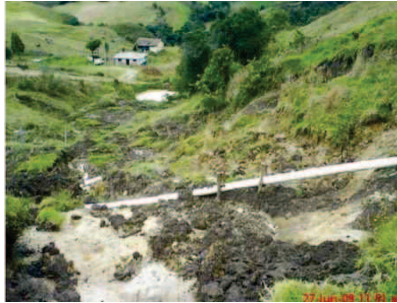
Figura 1. Línea de conducción del municipio de Samacá (Boyacá), la cual se dispone sobre una zona de alta inestabilidad geotécnica, dando lugar a la incidencia de altas pérdidas técnicas en el momento de falla del terreno.

Por otra parte, resulta importante destacar algunos apartes de una nota especial publicada por el periódico Boyacá 7 Días, el viernes 26 de febrero de 2010, en la cual se expresa que a pesar de la coyuntura en materia de agua, que se desarrolla en Boyacá, más de cien (100) municipios presentan dificultades en la prestación eficiente del servicio, dando lugar a la posición número uno (01), a nivel departamental, por desabastecimiento. Otra publicación expuesta el 5 de febrero de 2010, reconoce los efectos de agua en la zona rural del municipio de Tunja, en donde 13 veredas sufren de racionamiento, perjudicando a cerca de ocho mil (8.000) personas en El Porvenir, Chorro Blanco, Pirgua, La Colorada, Tras del Alto y La Esperanza. Bajo estos antecedentes, es clara la necesidad de mejorar los procedimientos en la concepción de los sistemas de abastecimiento, aún más, en la interiorización de las políticas públicas hacia una consciencia de uso racional del recurso hídrico.