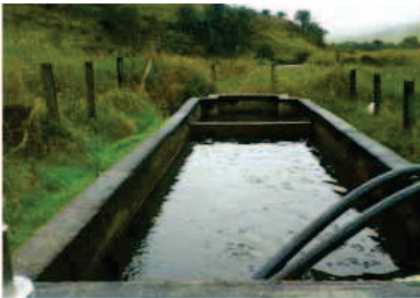
a) Desarenador principal

Saliendo del desarenador principal, el agua es conducida a través de una tubería de asbesto ce-