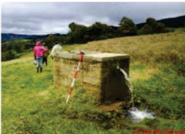
c) Cámara de quiebre