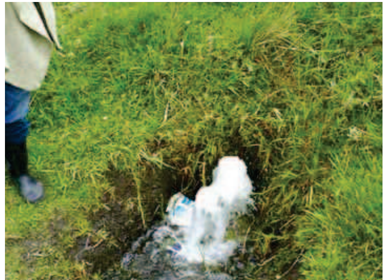
Figura 2. Descripción de un punto hidráulico en el sistema de abastecimiento del municipio de Samacá, en el cual se observa el desperdicio y desuso eficiente del agua.

A pesar de los problemas que son causados por la disminución del recurso hídrico (i.e., desabastecimiento de agua potable, racionamientos de energía, entre otros), el uso racional del agua se extiende desde una consciencia por el aprovechamiento eficiente hasta la conservación del mismo; esto último,