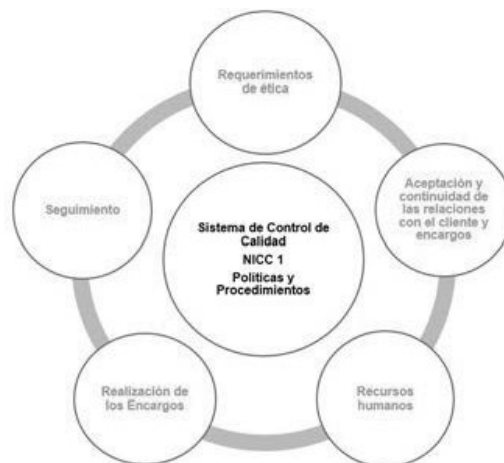
Figura 1. Políticas y procedimientos Sistema de Control de Calidad NICC-1.