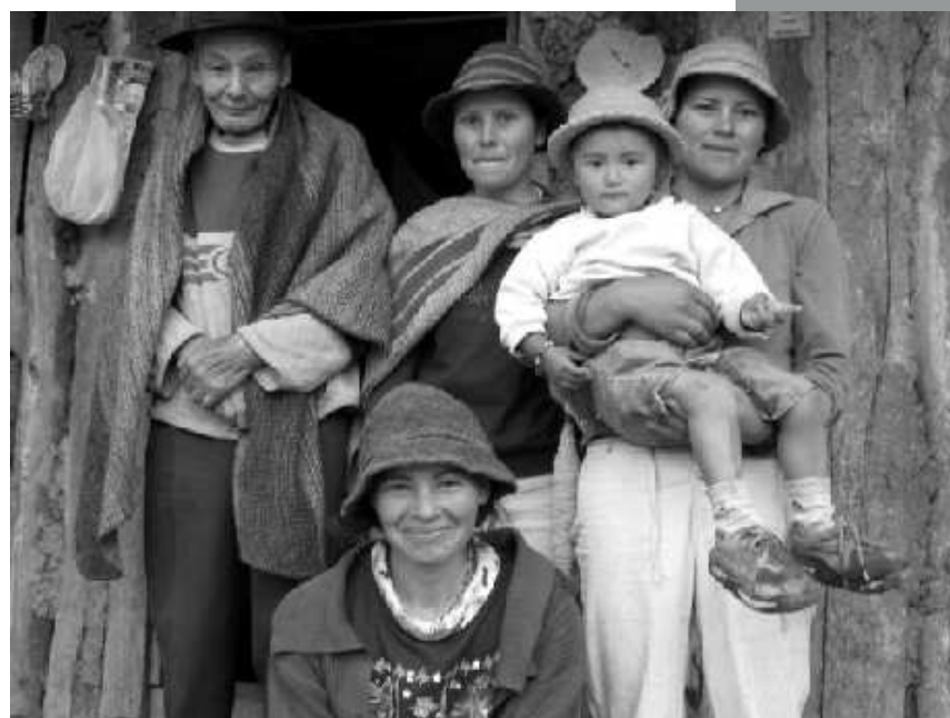
Ilustración 1. Familia campesina Boyacense. Autor

El nombre de “BOYACÁ” se remonta al origen chibcha y quiere decir «cercado del Cacique o región de las mantas», (Ocampo, J. 1997. Identidad de Boyacá, p. 5), quien dice, “Con este