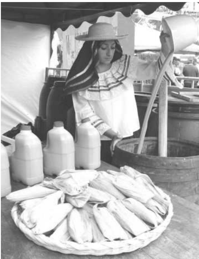
Ilustración .Mujer Boyacense en una Feria. Autor

concentra la población más densamente, las inquietudes y pasiones tienden a multiplicarse y a crear un sentido más empírico de la vida, el paisaje se asocia al Altiplano Cundiboyacense, según Ocampo como “cercado del cacique, región de montes”, “... si existe un retazo del país a donde la vista encuentre una plácida visión de la naturaleza, esa es el paisaje boyacense”, (Ocampo, J. El imaginario en Boyacá, 2001, p. 15), esta asociación de los conceptos de paisajes, procede de diferentes maneras de entender la relación hombre tierra, en donde las pasiones destacan del boyacense un imaginario innato que debe resaltarse ante el turista, todo aquello que tiene que ver con sus tradiciones, fiestas y gastronomía es lo que marca la diferencia con otros departamentos y esto se desprecia muchas veces. 2