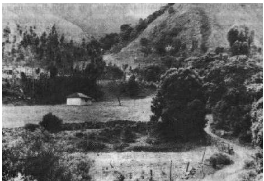
Foto: Ilustración 3. Paisaje Boyacense antiguo. Autor